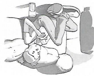
Eccola seduta per terra che guarda la TV.