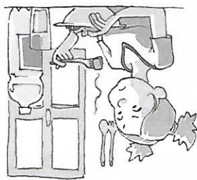
Alle 13 è a casa e mangia.