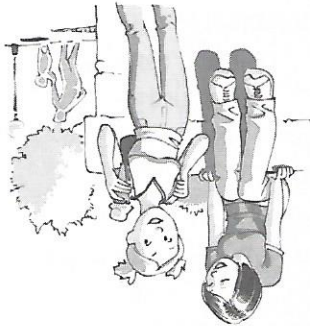
Qui è in piazza e si mangia un gelato.